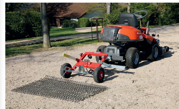
! Traîne métallique pour améliorer le travail de finition